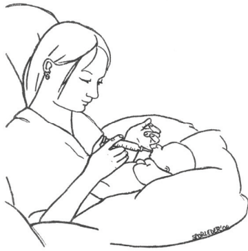
Abbildung 2: Fingerfütterung

Fingerfüttern eignet sich für Säuglinge mit Lippen-, Kiefer- und/oder Gaumenspalten ebenso wie für zu früh geborene Kinder (sobald sie in der Lage sind, Saugen, Schlucken und Atmen zu koordinieren), des weiteren für Säuglinge mit Beißreflex oder falschen Zungenbewegungen, bei zu hohem Gaumen usw. für Säuglinge mit Trisomie 21 und Pierre-Robin-Syndrom bedeutet diese Füttertechnik ein gutes Training der orofacialen Muskulatur.