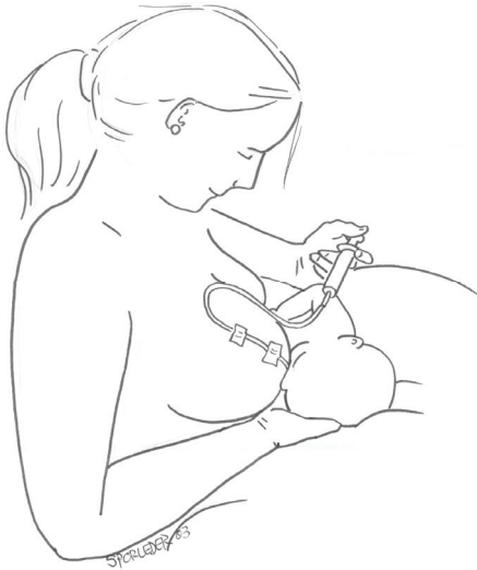
Abbildung 4: Zufüttern an der Brust

Solange die Saugleistung noch unzureichend ist, wird abgepumpte Muttermilch oder andere Nahrung über eine an der Brust befestigte Nahrungssonde, die an der Mamillenspitze endet, zugefüttert (Abb. 4).