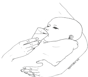
Abbildung 1: Becherfütterung

Zu beachten ist, dass mit diesen genannten Fütterungstechniken das Saugbedürfnis des Säuglings nicht befriedigt wird.